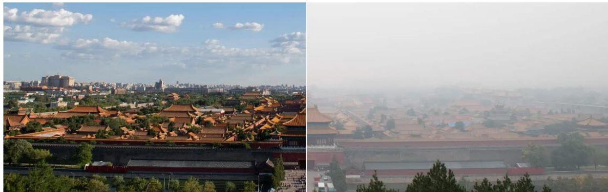
مقایسه دو روز پاک و آلوده از نمای شهر ممنوعه در پکن

شهرهای کشور چین به دلیل استفاده گسترده از سوخت زغال سنگ در این کشور، همواره جزو آلوده‌ترین شهرهای جهان هستند. به نحوی که طبق آمارها، در سال 2012 بیش از یک میلیون چینی به دلیل آلودگی هوا جان خود را از دست دادند! اما از سال 2013، دولت در طرحی موسوم به اقدام پنج ساله، مدیریت آلودگی هوا و افزایش روزهای پاک را در برنامه‌ی خود گنجانده است. نتیجه‌ی این امر، روند کاهشی انتشار انواع آلاینده‌ها در این سال‌ها و رضایت مردم از اقدامات مدیرانه دولت بوده است که همین امر سبب امید مردم برای بهبود کیفیت هوا در سال‌های بعد شده است. این روند در تصویر ذیل ترسیم و تحلیل شده است.